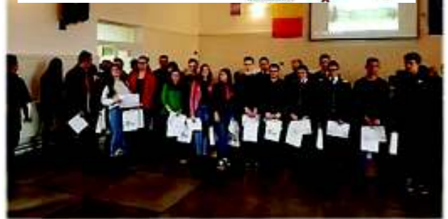
Ceșta Comitetului nr. 49 / Târnăveni, județul Iași, din data de 10.12.2019

O inițiativă deosebită a unui confrate a dus la un nou proiect care a devenit permanent și anume Concursul de Istorie pentru colegiile din județ. Acest proiect a prins consistență, el devenind un reper atât al nostru dar mai ales pentru gazdele acestui concurs și anume Colegiul Național Lucian Blaga din Sebeș.